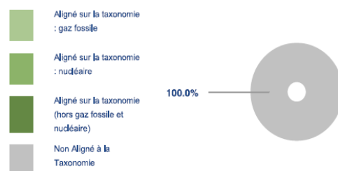
Ce graphique représente 100% du total des investissements.

* Aux fins de ces graphiques, les «obligations souveraines» comprennent toutes les expositions souveraines.